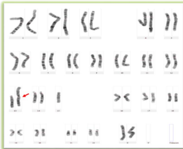
تصویر شماره ۵: کاریوتایپ فرد حامل جابجایی بین کروموزوم ۱۳ و ۱۵ به روش G بندینگ: 45,XX,der(13;15)(q10;q10)