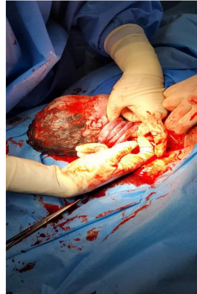
شکل ۲: نشان دادن یک جنین با چرخش چهار دور بندناف دور گردن.