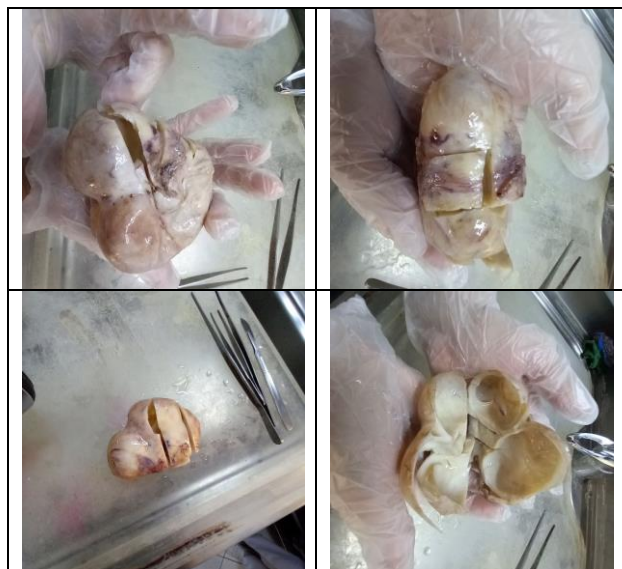
شکل ۱: سطح برش رحم با تشکیل کیست بدون ارتباط با آندومتر.