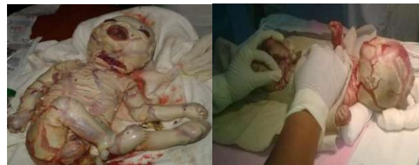
شکل ۱: ایکتیوز دلکی به عنوان یک اختلال نادر درماتولوژیک مادرزادی [۱۳] .

آمینوتومی بر روی خانم باردار انجام شد که مایع شفاف و به مقدار کافی بود. یک ساعت و ۳۰ دقیقه بعد، زایمان طبیعی انجام شد و نوزاد پسر با آپگار ۶ از ۱۰، وزن ۴۲۹۰ گرم، قد ۵۴ سانتی متر با کمی مشکلات متولد گردید. نوزاد آنومالی ظاهری داشت که با سندرم سینداکتیلی که انگشت های پا دو به دو به هم چسبیده بود و چهره دلکی یا ایکتیوز متولد شد. انگشتان دست پهن، زبان کبودرنگ و لته ها و گوش ها غیر طبیعی و غیر نرمال دیده شدند. همچنین نقاط قرمز و سفید رنگی بر روی قفسه سینه ی نوزاد وجود داشت. پوست تمام قسمت های بدن دو رنگ مشاهده گردید و لب پائین قرمز کبودرنگ بود. نوزاد بعد از تولد کاملاً هاپیوتون و سیانوز بود و به دلیل اختلال در تنفس و تاکی پنه به بخش NICU منتقل و از تماس پوستی و تغذیه از شیر مادر جلوگیری شد. واکسیناسیون بدو تولد انجام شده و آنوس باز بود. در تاریخ ۱۴۰۰/۱۰/۱۱، اکوی قلب انجام شد که PDA ۲ و PFO ۳ داشته و قرار شد دو هفته دیگر مجدد اکو گردد. نوزاد یک روز با استفاده از دستگاه سی پی (CPAP یا فشار پیوندی مثبت پیوسته اکسیژن) ۵ تنفس کرد. به مدت یک روز زیر هود نگهداری و در تاریخ ۱۴۰۰/۱۰/۱۴ با دستور پزشک اجازه ی مرخصی داده شد.