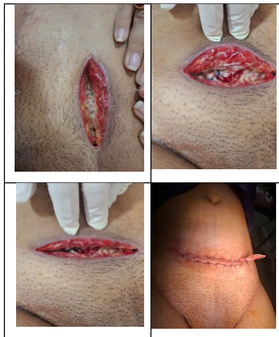
شکل ۱: نمای ماکروسکوپی و میکروسکوپی جفت و بند ناف در کوریوآمنیونیت حاد نکروزان

در زمینه تصمیم‌گیری درمانی، مطالعات متعدد بر اهمیت ختم به‌موقع بارداری در موارد مشکوک به عفونت داخل رحمی، به‌ویژه در حضور PROM و علائم پیش‌رونده، تأکید کرده‌اند. در این گزارش، تصمیم به انجام سزارین اورژانسی با هدف کاهش خطر عوارض عصبی جنینی، از