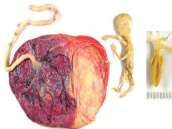
شکل ۱: نمایی از جنین پاپيروسی در کنار قل برادر زنده [۱۵] .

Disseminated intravascular coagulation ۱