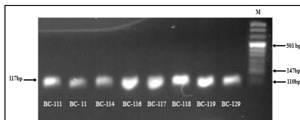
شکل ۲. بررسی بیان mRNA ژن HPRT در چند نمونه که بر روی ژل آگاروز ۱٫۵ درصد برده شد. طول محصول RT-PCR ۱۱۷ جفت باز بود. در این ژل از مارکر وزنی VIII DNA محصول ROCHE استفاده گردید.

در ابتدا از میان ژن‌های خانه‌دار انتخاب شده، ژن HPRT جهت نرمال کردن نمونه‌ها انتخاب گردید. در ادامه تمامی نمونه‌ها از نظر بیان ژن خانه‌دار ( HPRT ) مورد بررسی قرار گرفتند (شکل ۲ و ۳).