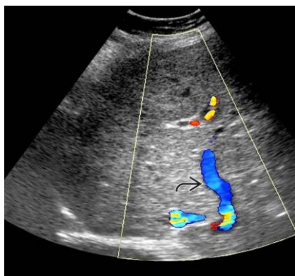
شکل ۴: سونوگرافی داپلر رنگی در بیمار مورد نظر یک تصویر بزرگ ورید جانبی داخل کبدی را نشان می‌دهد که وریدهای مسدود شده کبدی را دور می‌زند.