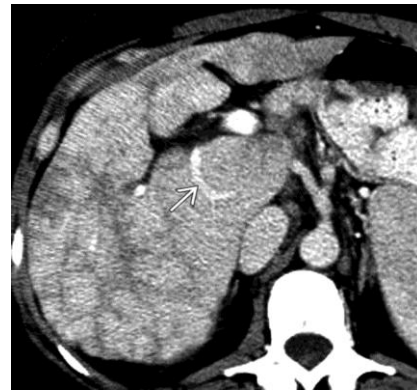
شکل ۲: توموگرافی کامپیوتری با دوز بالا (CECT)، محوری، هاپیترتروفی دمی، تصویر ورید جانبی دمی بزرگ و آتروفی و ناهمگنی محیطی را نشان می‌دهد. همچنین، وریدهای کبدی مسدود شده‌اند.

در طی حاملگی؛ آزمایشات غربالگری، NITP بیمار و اکوی قلب مادر و جنین تقریباً در هر ویزیت انجام گرفت و همگی نرمال بودند. بیمار به طور متوالی توسط پزشک فوق تخصص گوارش خود ویزیت شد و مرتباً تست‌های کبدی چک گردید. با وجود افزایش زیاد آنزیم‌های کبدی، دوز داروها تغییر داده شد. در هفته ۳۱ تا ۳۲ حاملگی به دنبال تزریق بتامتازون جهت بلوغ ریوی جنین و احتمال انجام زایمان زودرس و ختم بارداری زوتر از موعد دچار آبسه فک گردید که تخلیه و آنتی‌بیوتیک تراپی انجام شد. نهایتاً در ۳۵ هفته به علت سردرد، فشار خون ۱۴۰/۹۰ مراجعه نمود و به دلیل شروع دردهای زایمانی و بارداری پر خطر، IVF با تخمک اهدایی، فشارخون بالا، سندرم بودکیاری، داپلر مختل، دیابت شیرین بارداری، کولیت اولسراتیو در تاریخ ۱۴۰۱/۰۴/۰۸ بستری شد و تحت سزارین اورژانس قرار گرفت. دختر سالم با آپگار ۹/۱۰ و وزن ۲۳۶۰ گرم، قد ۴۹ سانتی‌متر و دور سر ۳۳ سانتی‌متر متولد شد. روز بعد، به علت فشارخون بالا با مشاوره متخصص قلب سولفات منیزیم شروع شد. نهایتاً، بیمار در تاریخ ۱۴۰۱/۴/۱۱ با شرایط پایدار ترخیص گردید (شکل ۳ و ۴).