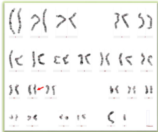
تصویر شماره ۶: کاربوتایپ فرد حامل واژگونی پاراسنتریک کروموزوم ۱۴ به روش G بندینگ: 46,XY,inv(14)(q21.2q31.2)

در میان زوج‌های حامل ناهنجاری‌های کروموزومی این مطالعه، ۱۸ (۱۰٫۷ درصد) مورد واژگونی پری سنتریک یافت شد، که یک مورد از این موارد، واژگونی 9p11.2q12 و ۱۷ مورد دیگر واژگونی در ناحیه p11.2q13 بودند. در دو مورد فرد مبتلا به آتاکسی ۲۳ و در یک مورد فرد نابارور مشاهده گردید. بیشتر پژوهشگران واژگونی کروموزوم ۹ را به عنوان پلی مورفیسیم کروموزومی خوش خیم در نظر می‌گیرند. اگرچه، وارونگی کروموزوم ۹ مدت زیادی است به عنوان واریانت طبیعی با شیوع ۱ تا ۳ درصد در نظر گرفته می‌شود و به عنوان ناهنجاری کروموزومی تلقی نمی‌شود [۱۸] . در این مطالعه نرخ فراوانی ۱٫۷ درصد مشابه جمعیت نرمال می‌باشد. برخی از پژوهش‌ها مبنی بر ارتباط بین واژگونی کروموزوم ۹ با کاهش باروری، سقط مکرر و بیماری‌های قلبی، شانس افزایش اختلالات کروموزومی و مرگ جنین در داخل رحم را گزارش کردند [۲۰،۱۹] . طبق مطالعه Babu و همکاران در سال ۲۰۰۶، انواع مختلفی از واژگونی‌ها را در ۴۲٫۱ درصد از افراد مشاهده کردند که در میان آن‌ها، واژگونی کروموزوم ۹ با شیوع ۶۴ درصد بیشترین نوع را تشکیل می‌داد و ۹٫۳۳ درصد از این نوع واژگونی در کودکانی که دارای اختلالات دیس مورفولوژیک ۲۴ و ناهنجاری مادرزادی