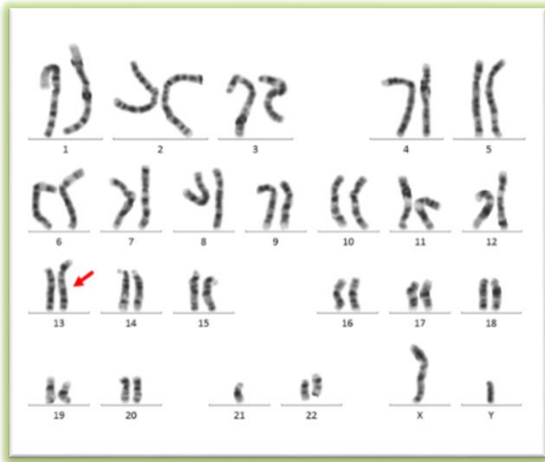
تصویر شماره ۴: کاریوتایپ فرد حامل جابجایی بین کروموزوم ۱۳ و ۲۱ به روش G بندینگ: 45,XY,der(13;21)(q10;q10)