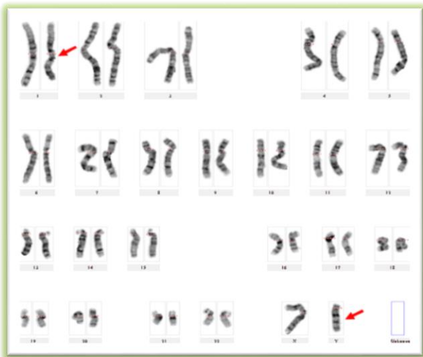
تصویر شماره ۱: کاریوتایپ فرد حامل جابجایی دو طرفه بین کروموزوم ۱ و Y به روش G بندینگ: 46,XY,t(1;Y)(q31;q12)

و Y (q31;q12)(1;Y)t(1;Y)XY,46 می باشد که در تصویر شماره ۱ به صورت G-banding و تصویر شماره ۲ C-banding را نشان می‌دهد و مورد بعدی زنی با جابجایی دو طرفه بین کروموزوم‌های ۱ و ۵ (q32.1;p13.3)(1;5)t(1;5)XY,46 می‌باشد که در تصویر شماره ۳ نشان داده شد. جابجایی رابرتسونین در سه مورد مشاهده گردید که یک مورد آن مردی با جابجایی رابرتسونین بین کروموزوم‌های ۱۳ و ۲۱ (q10;q10)(13;21)XY,45 (تصویر شماره ۴) و مورد بعدی آن مردی با جابجایی بین کروموزوم‌های ۱۳ و ۱۵ (q10;q10)(13;15)XY,45 می‌باشد (تصویر شماره ۵). واژگونی ۱۸ فراوان‌ترین ناهنجاری‌های مشاهده شده در این مطالعه بودند که واژگونی کروموزوم ۹ به عنوان یک پلی‌مورفیسم شایع در ۱۸ مورد مشاهده شد. یک مورد واژگونی کروموزوم ۱، یک مورد واژگونی کروموزوم ۲ و یک مورد واژگونی کروموزوم ۱۴ (q21.2;q31.2)(14)XY,46 (تصویر شماره ۶) مشاهده گردید. یک بیمار واجد واژگونی پری‌سنتریک بزرگ در یک کروموزوم ۹ بود. یک بیمار واجد دخول قطعه‌ای از کروموزوم با منشا ناشناخته درون بازوی کوتاه کروموزوم ۳ بود. یک مورد واجد کروموزوم مارکر بود که اندازه آن کوچک، متاسانتریک و در دو انتها ساتلایت داشت و به نظر نمی‌آمد که حاوی ماده یوکروماتین باشد. همچنین، یک مورد سندرم سه گانه X دیده شد.