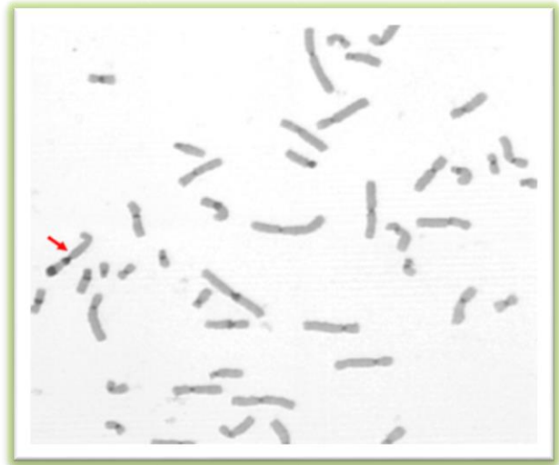
تصویر شماره ۲: گستره نشان دهنده جابجایی بین کروموزوم ۱ و Y به روش C بندینگ: 46,XX,t(1;Y)(q31;q12)