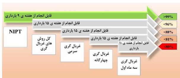
شکل ۳. مقایسه قدرت تشخیص سندرم داون به وسیله‌ی روش‌های مختلف