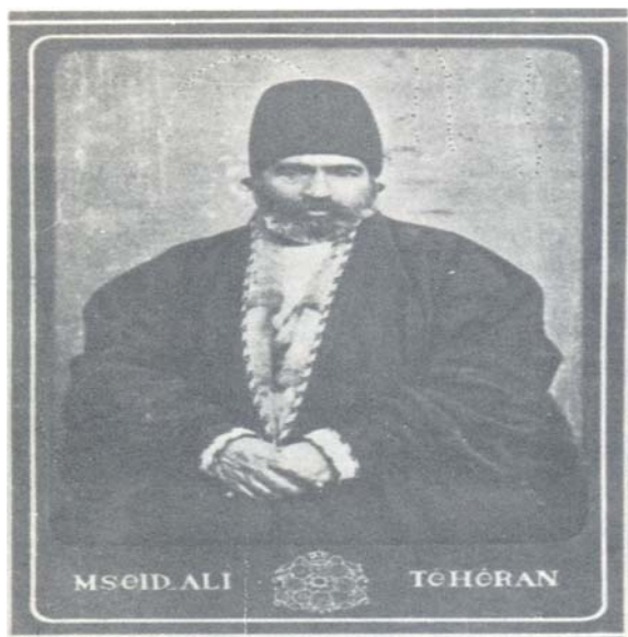
تصویر ۱) میرزا عیسی‌خان (وزیر تهران)

کامران میرزا نایب‌السلطنه را بر عهده گرفت [۲] . در سال ۱۲۸۸ قمری، به علت بروز قحطی و گرانی نان، میرزا را معزول کردند و تقریباً تا ۲۰ سال بعد از آن، کار مهمی نداشت [۱] . (میرزا عیسی در سال ۱۲۹۹ قمری به‌همراه امین‌الملک، حاجی میرزا عباسقلی، امین‌لشگر، معین‌الوزرا، مستشار، گران‌مایه و اعتمادالسلطنه از اجزای مجلس تحقیق بودند). پس از مرگ محمدابراهیم‌خان وزیرنظام (در ۸ صفر ۱۳۰۹) دایی کامران میرزا، مجدداً به وزارت تهران و ریاست بنایی و خالصجات گماشته شد و یک سال و چند روز در این مقام بود و عاقبت به مرض وبا درگذشت و در زاویه شمال غربی مسجد شیخ هادی در خیابان شاهپور به خاک سپرده شد [۲،۳] .