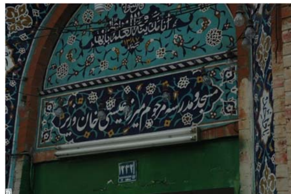
تصویر ۱۶) سردر مسجد و مدرسه موقوفه مرحوم میرزا عیسی‌خان وزیر (احداث‌شده توسط شیخ هادی نجم‌آبادی)

می‌پرداخت و سرانجام در چهارشنبه بیستم جمادی‌الآخر ۱۳۲۰ قمری جان به جان‌آفرین تسلیم کرد و با خوش‌نامی تمام، جهان فانی را وداع گفت [16] .