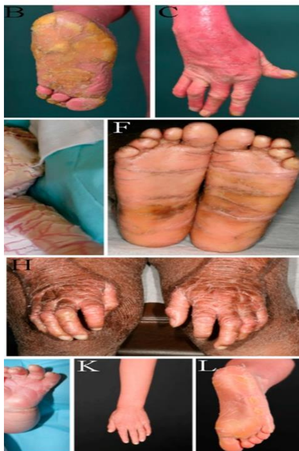
شکل ۳. نمایی از وضعیت پس از عبور از مرحله حاد ایکتیوز هارلیکوئین.