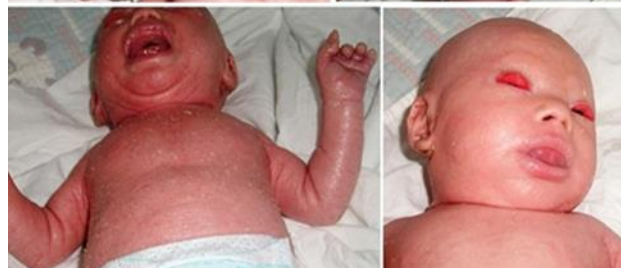
شکل ۲. اکتروپیون (برگردان پلک‌ها)، اکلایبون (لب‌های برآمده)، دفورمیتی‌های انقباضی اندام‌ها در ایکتیوز هارلیکوئین.